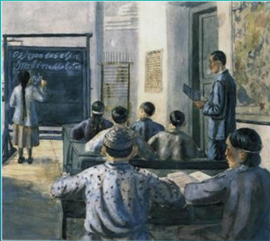
Әбілхан Қастеев (1904-1973). Ликбез. Из серии «Старый и новый быт». 1940. Центральный государственный музей РК, Алматы.

Источник: Әбілхан Қастеев. – Алматы: Өнер, 2004. -158 с.