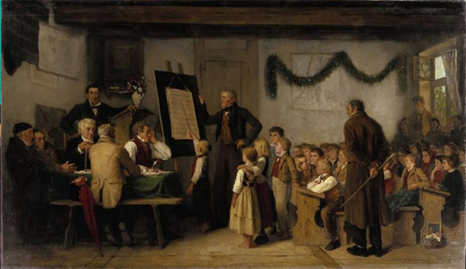
Альберт Анкер (1831-1910). Школьный экзамен (Экзамены в школе в кантоне Берн). 1862.