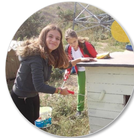
Hisar School Turkey