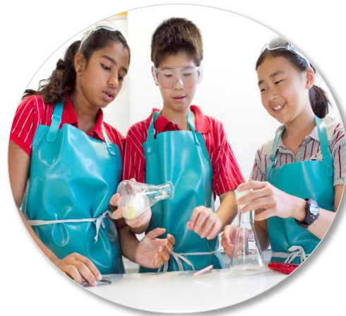
Discovery College Hong Kong