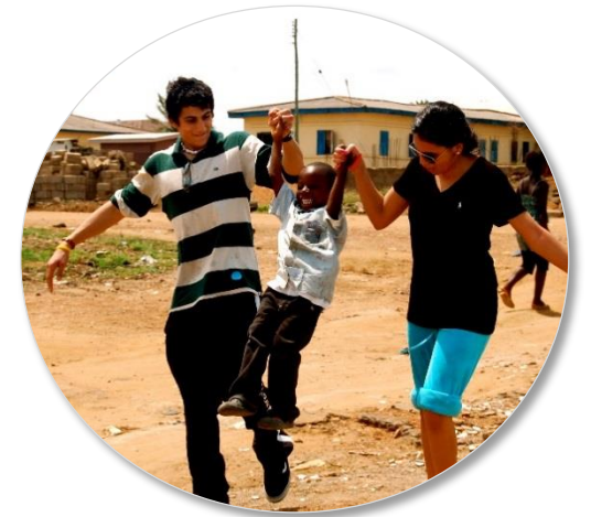
King's Academy Jordan