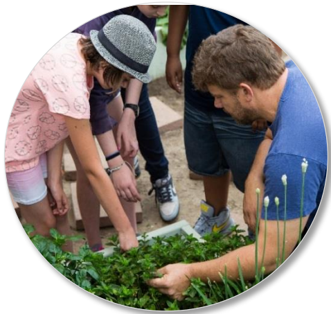
Turning Point School United States