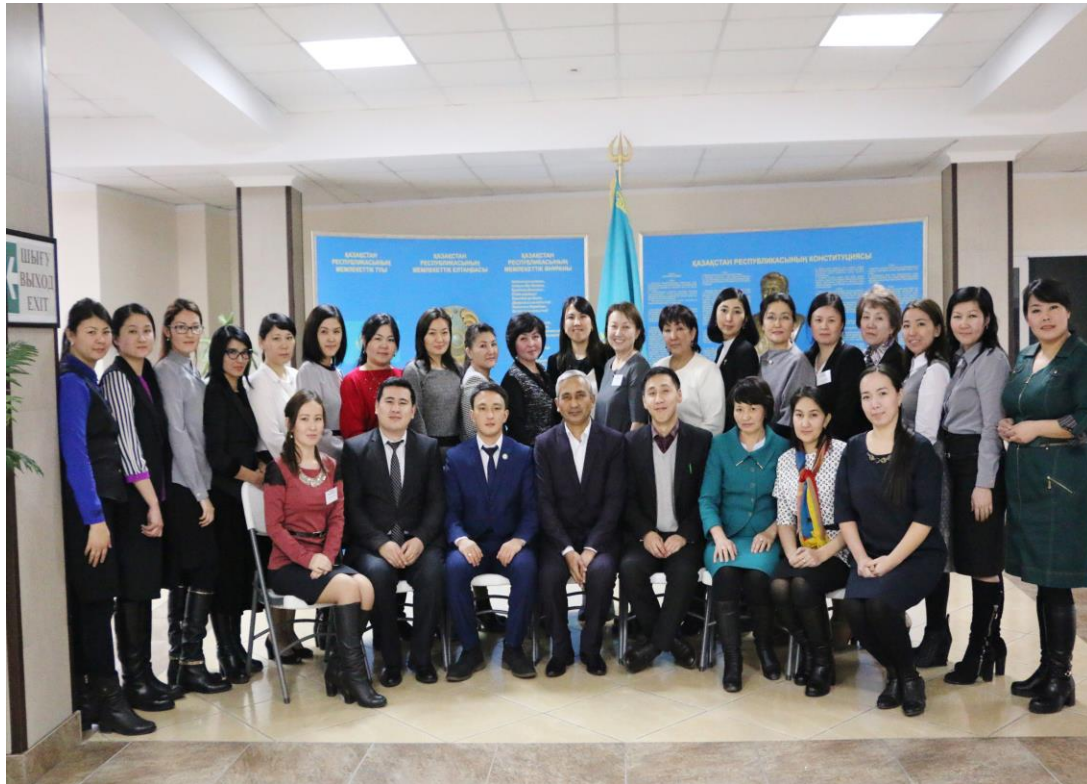
Фото: мектепаралық кездесу №1