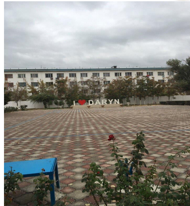
Фото. “Дарын” мектеп-интернаты