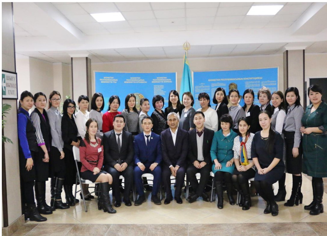
Фото: 1-я межшкольная встреча учителей из 4 школ Тараза