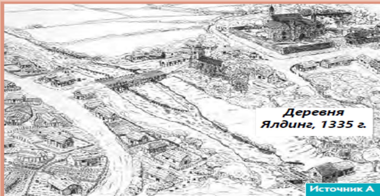
Деревня Ялдинг, 1335 г.