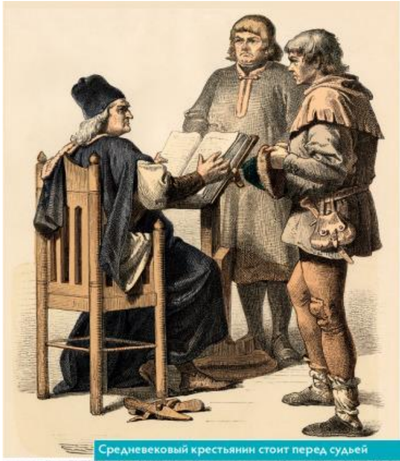
Средневековый крестьянин стоит перед судьей

Research Skills: Work with primary sources, various types of resources for collecting material on a research topic